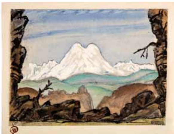
Лот 28. Добужинский Мстислав Валерианович (1875–1957) Эскиз декорации к 2 акту балета «Кавказский пленник» в постановке труппы «Ballet international du Marquis de Cuevas» в Нью-Йорке. 1957 г. Бумага, гуашь, чернила, карандаш. 18,2 x 24,2 см