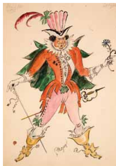
Лот 20. Добужинский Мстислав Валерианович (1875–1957) Эскиз костюма Леандра для балета «Арлекинада» в постановке Литовского театра оперы и балета в Каунасе. 1934 г. (?) Бумага, гуашь, акварель. 32,3 x 23,1 см