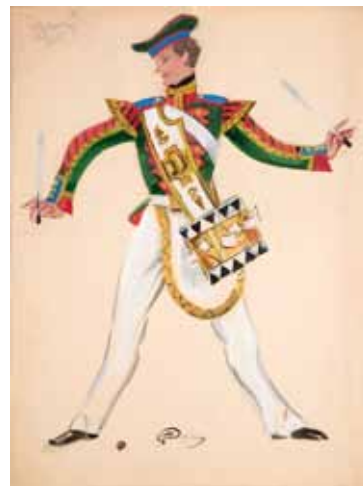
Лот 37. Добужинский Мстислав Валерианович (1875–1957) Эскиз костюма кадета-барбанщика для балета «Выпускной бал» в постановке труппы Русский балет Монте-Карло. 1945 г. Бумага, гуашь, уголь. 35,5 x 26,5 см