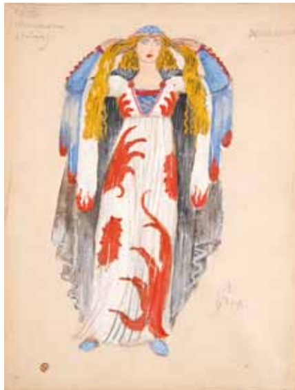
Лот 54. Добужинский Мстислав Валерианович (1875–1957) Эскиз костюма Призрака из «Макбета» к балету «Видения» (по произведениям У. Шекспира) в постановке Монреальского балета Рут Сорель. 1949 г. Бумага, гуашь, акварель, чернила, карандаш. 29,6 x 22,6 см