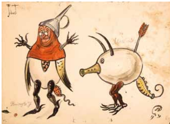
Лот 9. Добужинский Мстислав Валерианович (1875–1957) Эскиз костюмов двух персонажей из сцены Вальпургиевой ночи к опере «Фауст» в постановке Литовского театра оперы и балета в Каунасе. 1931 г. Бумага, гуашь, акварель, тушь. 25 x 34,7 см