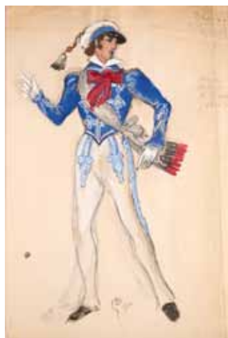
Лот 36. Добужинский Мстислав Валерианович (1875–1957) Эскиз мужского костюма для балета «Выпускной бал» в постановке труппы Русский балет Монте-Карло. 1945 г. Бумага, гуашь, уголь. 37,8 x 26,5 см