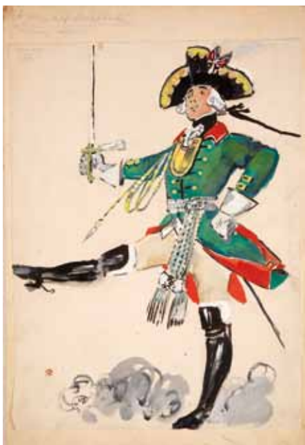
Лот 30. Добужинский Мстислав Валерианович (1875–1957) Эскиз костюма офицера к балету М. Фокина «Русский солдат» в постановке Театра оперы в Бостоне при участии балетной труппы Метрополитен Опера. 1942 г. Бумага на картоне, гуашь, тушь, карандаш. 32,2 x 24 см