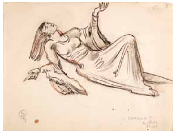
Лот 56. Добужинский Мстислав Валерианович (1875–1957) Эскиз костюма Офелии к балету по произведениям У. Шекспира в постановке Монреальского балета Рут Сорель. 1948 г. Бумага, тушь, уголь, карандаш. 22,8 x 29,4 см