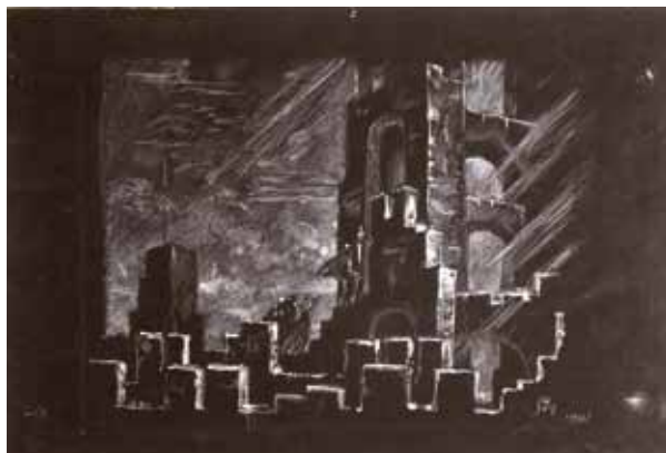
Лот 16. Добужинский Мстислав Валерианович (1875–1957) Эскиз декорации к первому действию спектакля «Гамлет» в постановке Литовского театра оперы и балета в Каунасе (Появление Призрака). 1933 г. Бумага, гуашь, белила. 31,5 x 48 см