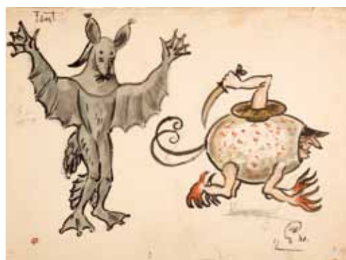
Лот 10. Добужинский Мстислав Валерианович (1875–1957) Эскиз костюмов двух персонажей из сцены Вальпургиевой ночи к опере «Фауст» в постановке Литовского театра оперы и балета в Каунасе. 1931 г. Бумага, гуашь, акварель, тушь. 26 x 35,4 см