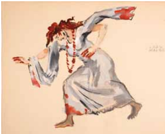
Лот 50. Добужинский Мстислав Валерианович (1875–1957) Эскиз костюма Леди Макбет к балету «Видения» (по произведениям У. Шекспира) в постановке Монреальского балета Рут Сорель. 1949 г. Бумага, гуашь, акварель, тушь, карандаш 22,7 x 29,5 см