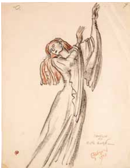
Лот 55. Добужинский Мстислав Валерианович (1875–1957) Эскиз костюма Офелии к балету по произведениям У. Шекспира в постановке Монреальского балета Рут Сорель. 1948 г. Бумага, тушь, уголь, карандаш. 29,5 x 22,7 см