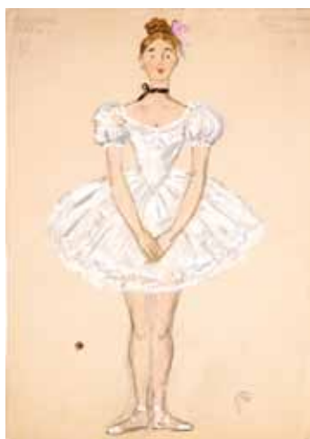
Лот 35. Добужинский Мстислав Валерианович (1875–1957) Эскиз женского театрального костюма для балета «Выпускной бал» в постановке труппы Русский балет Монте-Карло. 1945 г. Бумага, гуашь, уголь. 34,7 x 24,7 см