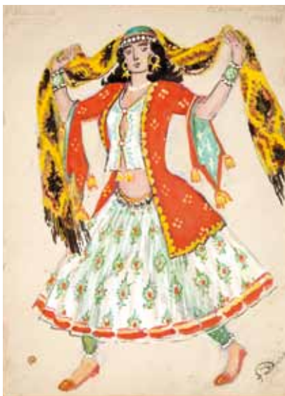
Лот 38. Добужинский Мстислав Валерианович (1875–1957) Эскиз костюма персидской танцовщицы к опере «Хованщина» в постановке Метрополитен Опера. 1948 г. Бумага на картоне, акварель, тушь, карандаш. 2,7 x 23,7 см