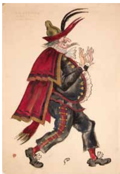
Лот 19. Добужинский Мстислав Валерианович (1875–1957) Эскиз костюма Кассандра для балета «Арлекинада» в постановке Литовского театра оперы и балета в Каунасе. 1934 г. Бумага, гуашь, акварель. 35,8 x 24,8 см