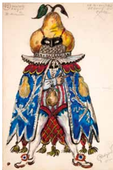
Лот 41. Добужинский Мстислав Валерианович (1875–1957) Эскиз костюма министра в маскардном костюме груши к опере «Мамзель Анго». 1952 г. Бумага, акварель, карандаш/ 36,6 x 24,7 см