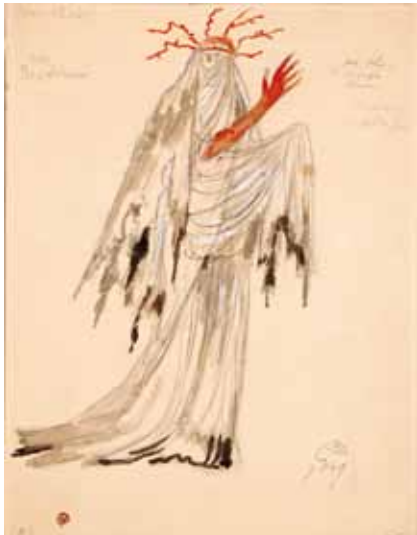
Лот 52. Добужинский Мстислав Валерианович (1875–1957) Эскиз костюма Призрака из «Макбета» к балету «Видения» (по произведениям У. Шекспира) в постановке Монреальского балета Рут Сорель. 1949 г. Бумага, гуашь, акварель, тушь, карандаш. 29,8 x 22,7 см