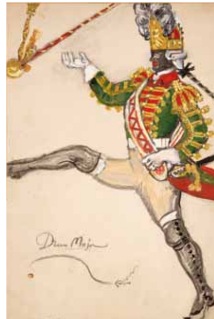
Лот 31. Добужинский Мстислав Валерианович (1875–1957) Эскиз костюма тамбурмажора к балету М. Фокина «Русский солдат» в постановке Театра оперы в Бостоне при участии балетной труппы Метрополитен Опера. 1942 г. Бумага на картоне, гуашь, чернила, карандаш. 37,3 x 25,1 см