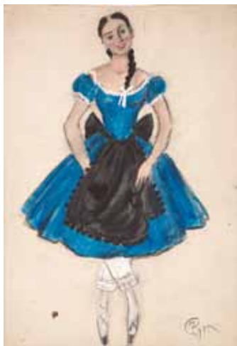
Лот 34. Добужинский Мстислав Валерианович (1875–1957) Эскиз костюма Девочки с косичками для балета «Выпускной бал» в постановке труппы Русский балет Монте-Карло. 1945 г. Бумага, гуашь, уголь. 36,8 x 24,9 см