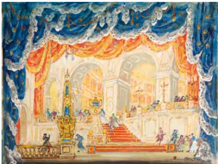
Лот 23. Добужинский Мстислав Валерианович (1875–1957) Эскиз декорации танцевального зала к опере Джузеппе Верди «Бал-маскарад» в постановке Метрополитен-опера. 1940 г. Картон, смешанная техника. 38,2 x 50,6 см