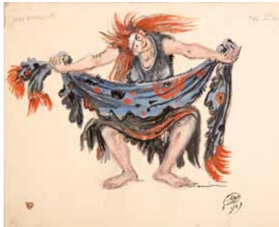
Лот 51. Добужинский Мстислав Валерианович (1875–1957) Эскиз костюма второй ведьмы из «Макбета» к балету «Видения» (по произведениям У. Шекспира) в постановке Монреальского балета Рут Сорель. 1949 г. Бумага, гуашь, акварель, тушь, карандаш 22,7 x 29,7 см