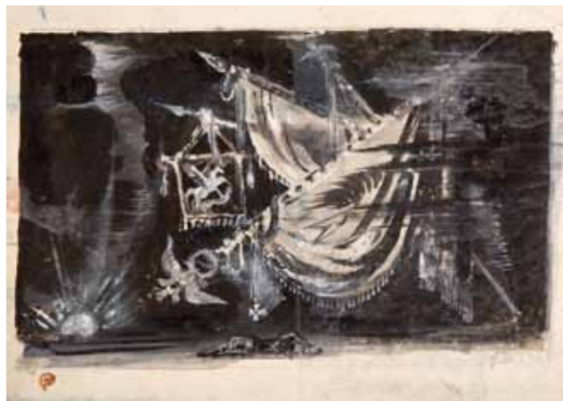
Лот 29. Добужинский Мстислав Валерианович (1875–1957) Эскиз декорации к балету «Русский солдат» в постановке Метрополитен Опера. 1942 г. Картон, гуашь. 19,2 x 26 см