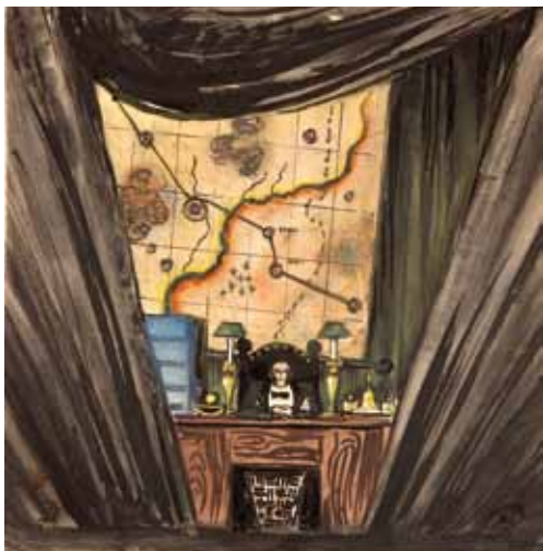
Лот 22. Добужинский Мстислав Валерианович (1875–1957) Эскиз декорации кабинета губернатора к спектаклю «Одержимые» (по роману Ф.М. Достоевского «Бесы») в постановке театра-студии Михаила Чехова. 1939 г. Бумага, гуашь, акварель. 25,2 x 24,2 см