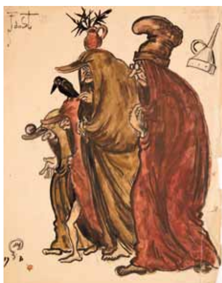
Лот 11. Добужинский Мстислав Валерианович (1875–1957) Эскиз костюмов четырех ведьм из сцены Вальпургиевой ночи к опере «Фауст» в постановке Литовского театра оперы и балета в Каунасе. 1931 г. Бумага, гуашь, акварель, тушь. 33,4 x 26 см