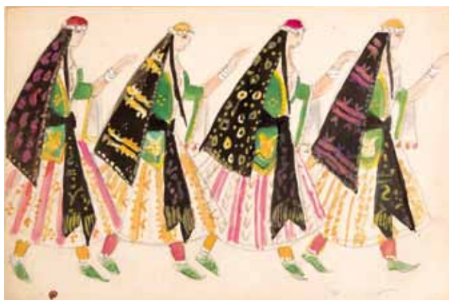
Лот 40. Добужинский Мстислав Валерианович (1875–1957) Эскиз четырех женских костюмов к опере «Хованщина» в постановке Метрополитен Опера. 1950 г. Бумага, гуашь, акварель, тушь, карандаш. 25 x 36,1 см