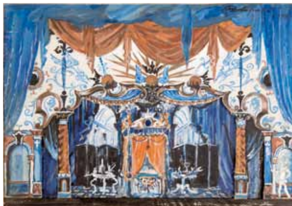
Лот 25. Добужинский Мстислав Валерианович (1875–1957) Макет декорации к опере «Любовь к трём апельсинам» в постановке «Нью-Йорк сити опера». 1949 г. Картон, гуашь. 24 x 32,1 см