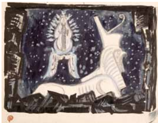
Лот 15. Добужинский Мстислав Валерианович (1875–1957) Эскиз декорации к опере «Волшебная флейта» в постановке Латвийской Национальной оперы. 1933 г. Бумага, гуашь, тушь. 16,6 x 21 см