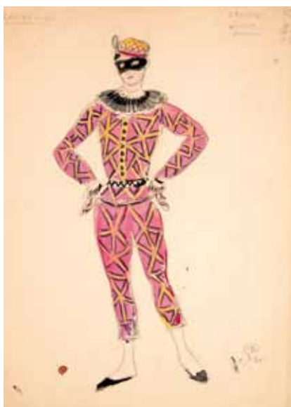
Лот 18. Добужинский Мстислав Валерианович (1875–1957) Эскиз костюма Арлекина для балета «Арлекинада» в постановке Литовского театра оперы и балета в Каунасе. 1934 г. Бумага, гуашь, акварель, белила. 34,7 x 24,8 см