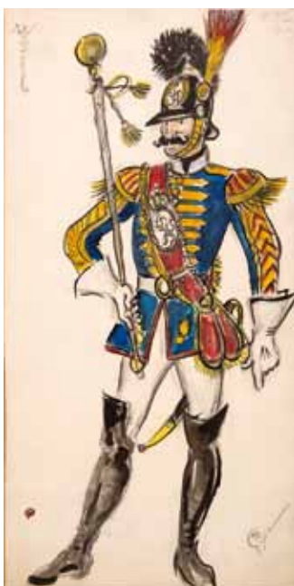
Лот 32. Добужинский Мстислав Валерианович (1875–1957) Эскиз костюма тамбурмажора к опере «Воцтек» в постановке «Нью-Йорк сити опера». Картон, гуашь, тушь, карандаш. 37,5 x 19,2 см