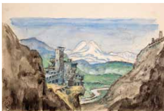
Лот 27. Добужинский Мстислав Валерианович (1875–1957) Макет декорации к балету «Кавказский пленник» в постановке в постановке труппы «Ballet international du Marquis de Cuevas» в Нью-Йорке 1957 г. а) Занавес фона второго действия. Бумага, акварель, гуашь, карандаш. 25 x 38 см. б) Передний план, вырезанный. Бумага, акварель, гуашь, карандаш. 27,6 x 44,5 см