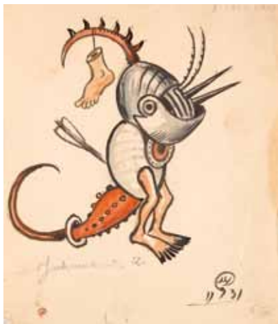
Лот 8. Добужинский Мстислав Валерианович (1875–1957) Эскиз костюма персонажа из сцены Вальпургиевой ночи к опере «Фауст» в постановке Литовского театра оперы и балета в Каунасе. 1931 г. Бумага, гуашь, акварель, тушь. 25 x 20,7 см