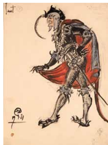
Лот 12. Добужинский Мстислав Валерианович (1875–1957) Эскиз костюма Мефистофеля к опере «Фауст» в постановке Литовского театра оперы и балета в Каунасе. 1931 г. Бумага, гуашь, акварель, тушь. 33,1 x 23,2 см