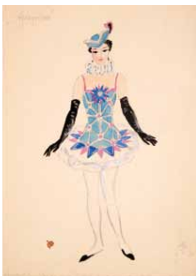
Лот 17. Добужинский Мстислав Валерианович (1875–1957) Эскиз костюма танцовщицы для Веры Немчиновой к балету «Арлекинада» в постановке Литовского театра оперы и балета в Каунасе. 1934 г. Бумага, гуашь, акварель. 29,6 x 20,8 см