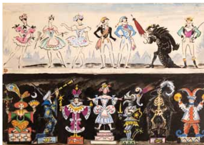
Лот 33. Добужинский Мстислав Валерианович (1875–1957) Эскиз костюмов 14 персонажей к балету «Коппелия» в постановке Парижской оперы. 1945 г. Картон, гуашь, тушь, карандаш. 28,9 x 41 см