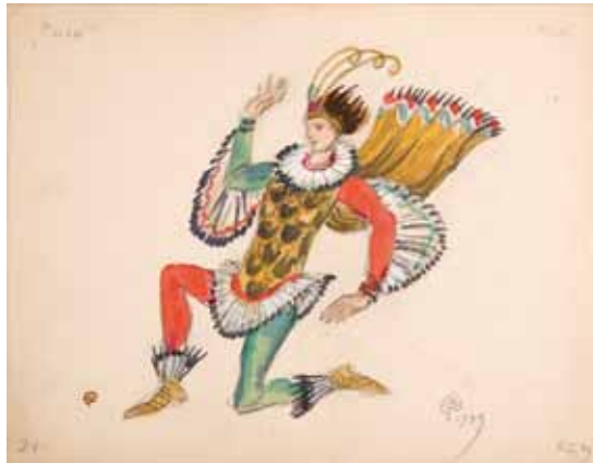
Лот 53. Добужинский Мстислав Валерианович (1875–1957) Эскиз костюма Пака из «Сна в летнюю ночь» к балету «Видения» (по произведениям У. Шекспира) в постановке Монреальского балета Рут Сорель. 1949 г. Бумага, гуашь, акварель, тушь, карандаш. 22,7 x 29,1 см