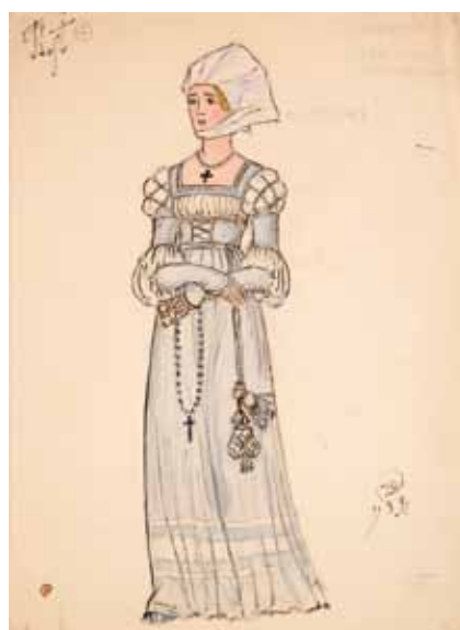
Лот 13. Добужинский Мстислав Валерианович (1875–1957) Эскиз костюма Маргариты к опере «Фауст» в постановке Литовского театра оперы и балета в Каунасе. 1931 г. Бумага, гуашь, акварель, тушь. 36 x 25,7 см