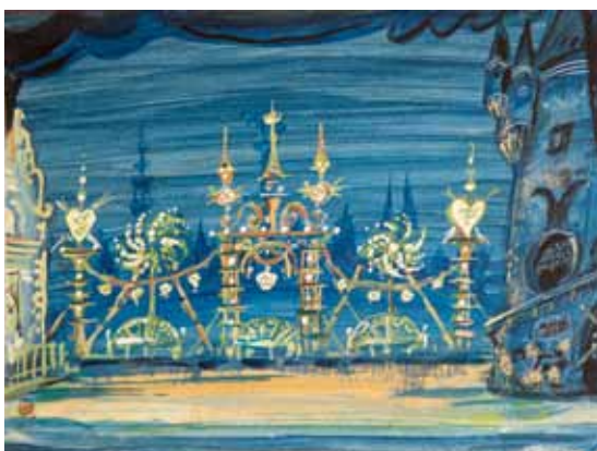
Лот 26. Добужинский Мстислав Валерианович (1875–1957) Эскиз декорации к балету «Мамзель Анго». 1949 г. Бумага, гуашь. 20,7 x 27,5 см